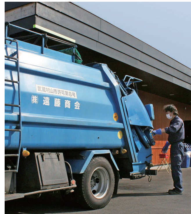
遠藤商会、超大手有名企業とのお取引も多いです。社員ひとりひとりが大切に、お客様への誠実な姿勢の成果です。

全国チェーン展開をしている「うどんや」の廃棄物回収です。お客様の食べ残しや、天ぷらの揚げかすなどの回収が主になります。生ごみ系の廃棄物という事で、害虫対策や汁物にも考慮し、ビニール袋に梱包してさらさらキヤスター付のペールにも入れ、ゴミ庫に保管されています。ゴミ庫から車両へ移動する際に、生ゴミの汁が路上にもれて悪臭が発生する事の防止や、ゴミの重量が重たいため、回収ドライバーの負担も考え、キヤスター付のゴミ箱になっているのが、工夫している点です。お客様のことを一番に考えるのも当然ですが、毎日の作業をするドライバーの負担を少しでも減らし、働きやすい環境をつくるという事も大切です。