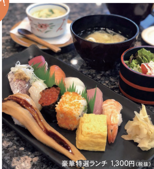
豪華特選ランチ 1,300円(税抜)

回転寿司ですが、本格的なお寿司を食べられるお店。味はもちろん、ランチメニューのコスパが抜群! おススメは「平日限定・日替わり握り」640円(税抜)。味噌汁付でこのお値段! 大きい穴子が付いた「豪華特選ランチ」は、茶わん蒸しとサラダ、味噌汁付で食べ応え十分。お値段も1300円(税抜)とリーズナブルです。握り以外にも丼物もあります。