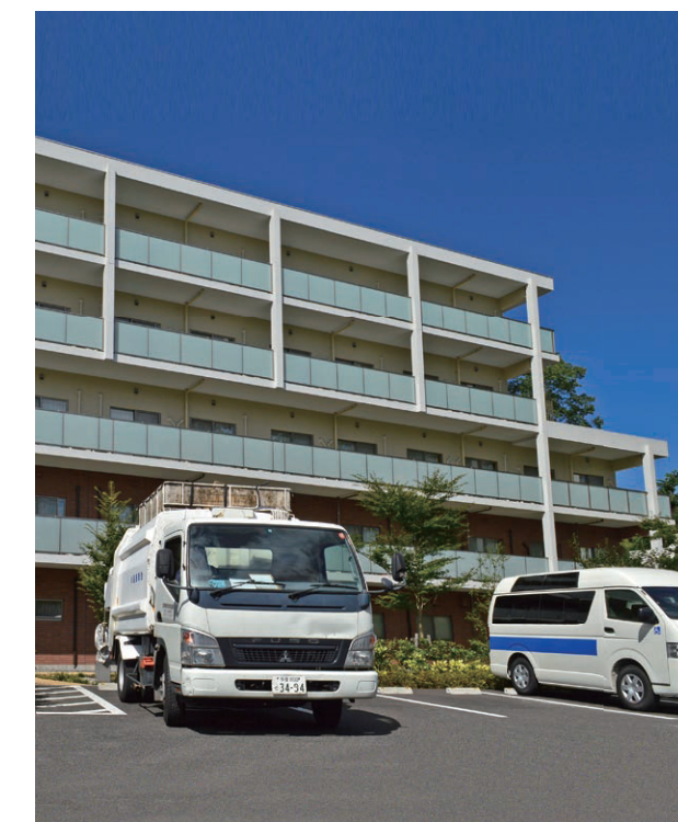
人の多い現場は、事前の段取りと周囲への配慮がかかせません。案件ごとに臨機応変に対応する洞察力が必要です。